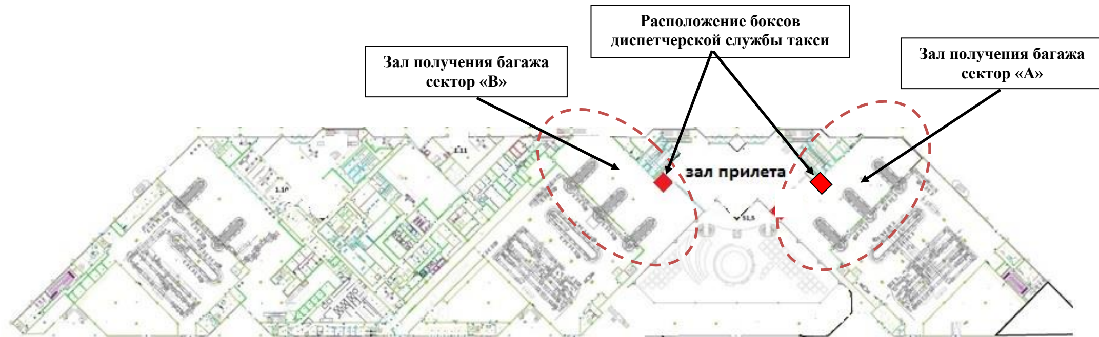
Схема 1-го этажа аэровокзального комплекса